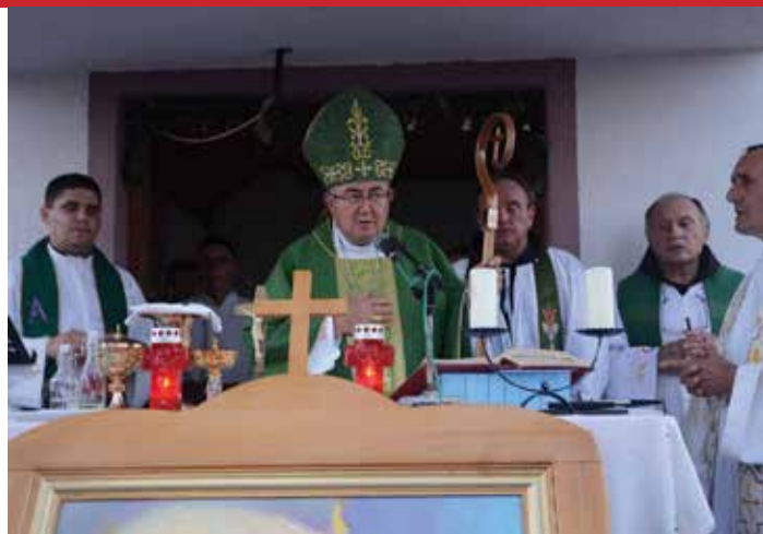
Kardinal Puljić predvodi slavije mise

na mjestu mučeništva sluge Božjega, mole i pjevaju te se sakramentalno izmiruju s Bogom i bližnjim u sv. ispovijedi. Potom se u procesiji išlo ka grobu sluge Božjega, u turističkom župnom groblju, gdje se s prvim čovjekom Crkve u Vrhbosni kardinalom Vinkom Puljićem slavila zavjetna sveta misa. Kruna završetka fra Lovrine nedjelje bila je u nedjelju 27. kolovoza u 11 sati: svetu misu na grobu mučenika predvodio je fra Marijan Karaula, vicepostulator fra Lovrine kauze.