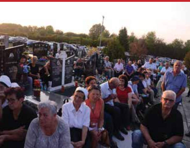
Okupljeni vjernici pozorno slušaju kardinalovu propovijed