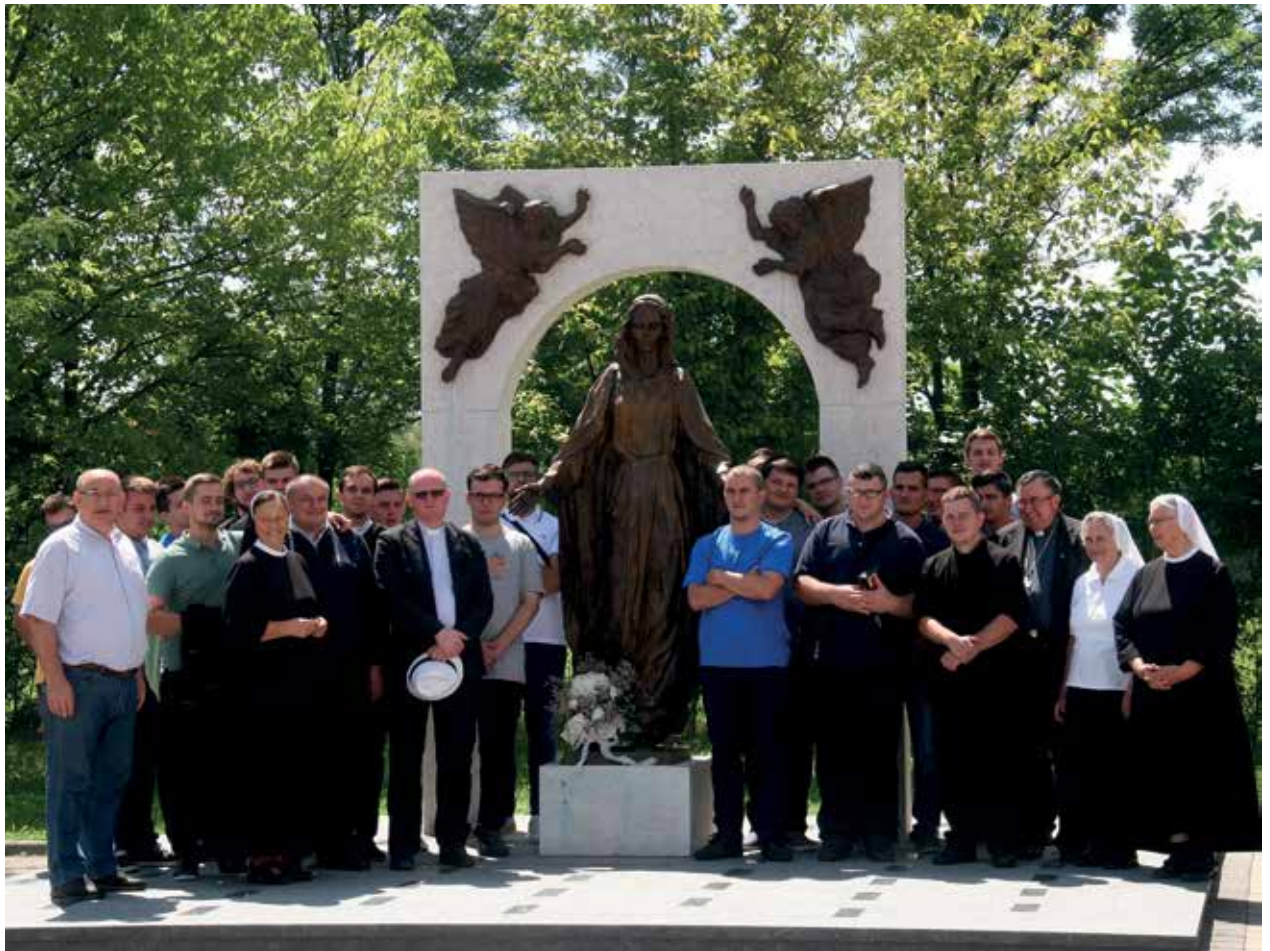
Kardinal Vinko Puljić s bogoslovima Vrhbosanske nadbiskupije, časnim sestrama i drugima u svetištu Gospe od anđela u Gornjoj Tramošnici