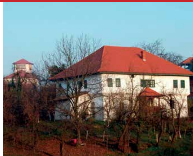
Kuća Gradaševića u Gradačcu

Britanski povjesničar Noel Malcolm, u knjizi Bosna. Kratka povijest (prvo izdanje na engleskom 1994, prijevod na bosanski