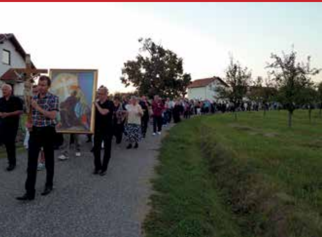
Procesija od groblja do stratišta